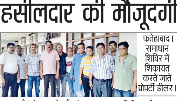
फतेहाबाद। समाधान शिविर में शिकायत करते जाते प्रोपर्टी डीलर।