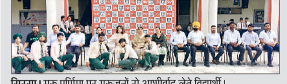
सिरसा। गुरु पूर्णिमा पर गुरुजनों से आशीर्वाद लेते विद्यार्थी।