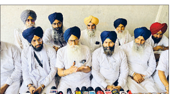
सिरसा। मीडिया से बातचीत करते अकाल पंथक मोर्चा के सदस्य।

हरियाणा सिख गुरुद्वारा प्रबंधक कमेटी में चल रही खींचतान में सरकार दखलअंदाजी ना करें, इसको लेकर अकाल पंथक मोर्चा के सदस्य वीरवार को गुरुद्वारा श्री दसवीं पातशाही में धरतारों से रूबरू हुए। उन्होंने कहा कि एक लंबी लड़ाई के बाद हरियाणा सिख गुरुद्वारा प्रबंधक कमेटी के चुनाव हुए जिसमें निष्पक्ष सदस्य चुने गए