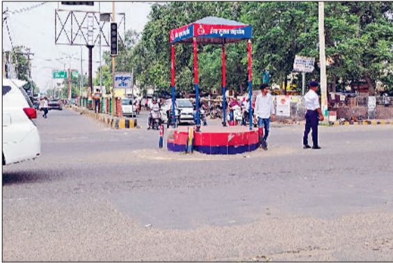
फतेहाबाद। शहर का लाल बत्ती चौक।

फतेहाबाद नगरपरिषद के चुनाव को तीन साल बीत जाने के बाद भी शहर में कोई विकास कार्य नहीं हो पाया। नगरपरिषद में आपसी राजनीतिक लड़ाई के चलते किसी भी अधिकारी व चुने हुए प्रतिनिधि का विकास कार्यों के प्रति कोई रुचि नहीं है। ऐसा नहीं है कि नगरपरिषद वित्तीय संकट से जूझ रही हो, फतेहाबाद नगरपरिषद के खाते इस समय पैसों से भरे पड़े हैं। शहर के 18 बंकों में नगरपरिषद की 70 करोड़ से अधिक की धनराशि ब्याज पर पड़ी है। शहरवासी सफाई, गलियों के निर्माण, गंदे पानी की निकासी के लिए दर-दर भटक रहे हैं लेकिन लोगों की समस्याओं का कोई समाधान नहीं हो रहा। यहां तक कि नगरपरिषद के महत्वकांक्षी प्रोजेक्ट चिल्ली झील का सौन्दर्यीकरण, मिनी बाईपास पर साइकिलिंग ट्रेक का