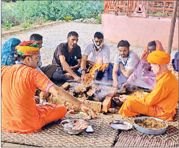
सिरसा। हवन यज्ञ में भाग लेते ग्रामीण।