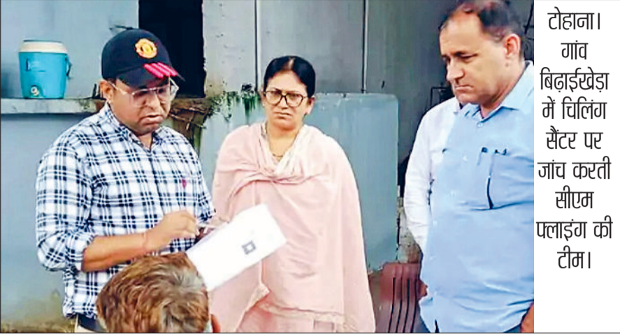
टोहाना। गांव बिदाईखेड़ा में चिलिंग सेंटर पर जांच करती सीएम फ्लाइंग की टीम।