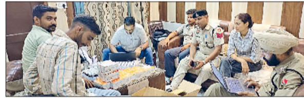
सिरसा। मौके पर कार्रवाई करती पुलिस व औषधि विभाग की टीम।