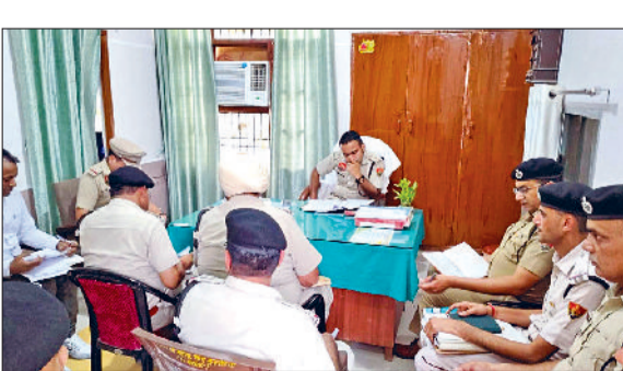
फतेहाबाद। थाने के निरीक्षण के दौरान अधिकारियों को निर्देश देते एसपी।