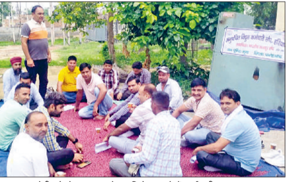
भूना। एसओपी को लेकर धरना देकर विरोध करते हैं कर्मचारी।

एसपी ने नागरिकों को सुझाव देते हुए कहा कि यदि आपको कोई गलती नहीं है और आपके खाते से किसी ने धोखे से राशि निकाली है, तो समय पर की गई शिकायत के आधार पर वह राशि आपको वापस मिल सकती है। इसके लिए सबसे पहले अपने बैंक को तुरंत सूचना दें, ताकि संदिग्ध लेन-देन को रोकना जा सके और आवश्यक कार्रवाई की जा सके। निकटतम पुलिस थाना, साइबर थाना अथवा साइबर अपराध शाखा में लिखित शिकायत दर्ज कराएं। साथ ही राष्ट्रीय साइबर अपराध पोर्टल पर शिकायत दर्ज करें या साइबर हेल्पलाइन नंबर 1930 पर कॉल करें।