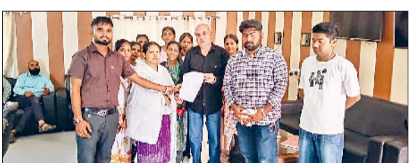
टोहाना। ज्ञापन सौंपते हुए छात्र।