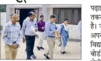
फतेहाबाद। स्कूलों का निरीक्षण करते संयुक्त निदेशक।